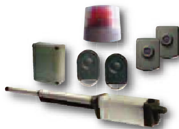
Solution Ixengo S 24V Pack Confort