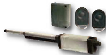
Solution Ixengo S 230V Pack Standard