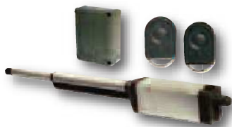
Solution Ixengo S 24V Pack Standard